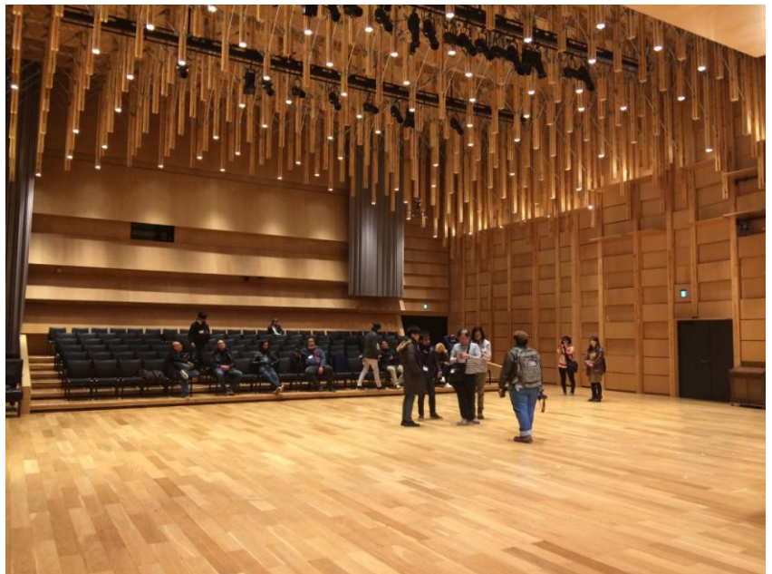
หอแสดงดนตรี (Recital Hall) ณ วิทยาเขตอุเอโนะ (Ueno Campus)

“ผลจากการเดินทางมาเยือนมหาวิทยาลัยศิลปะแห่งโตเกียวนี้ นอกเหนือจากจะได้รับความรู้ทางวิชาการและยังได้ สัมผัสกับบรรยากาศในช่วงปลายฤดูหนาว เรียนรู้ถึงวิถีในการดำเนินชีวิตที่จริงจังของโตเกียว และเทคโนโลยีซึ่งส่งผลกระทบต่อวิธีการสร้างสรรค์งานของศิลปิน ผลของวิถีธรรมชาติและการทำงานดำเนินชีวิตของผู้คนได้ถูกถ่ายทอด ให้เห็นความเป็นเอกลักษณ์ของคนโตเกียว ซึ่งเหล่านี้เป็นสิ่งที่ไม่สามารถสัมผัสได้ชัดเจนจากบริษัทสamsungไทย คณะอาจารย์และนักศึกษาของเราเดินทางกลับพร้อมด้วยความรู้และแรงบันดาลใจมากมาย โดยผู้เขียนเชื่อว่านักศึกษาได้ซึมซับประสบการณ์ดีๆหลายอย่างเพื่อนำมาใช้ต่อยอดในการสร้างสรรค์ของตนเอง”