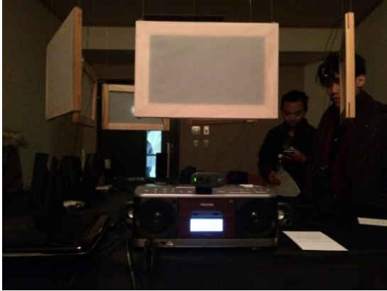
บางส่วนของตัวอย่างผลงานวิทยานิพนธ์ของนักศึกษา สาขาวิชา Musical Creativity and Environment