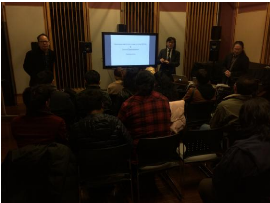
ส่วนหนึ่งจากการบรรยาย เรื่องพัฒนาการของดนตรีในญี่ปุ่น