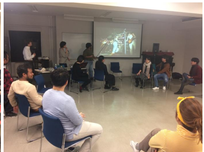
บรรยากาศในการร่วมชั้นเรียน