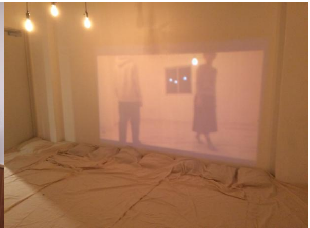
บางส่วนของตัวอย่างผลงานวิทยานิพนธ์ของนักศึกษาสาขาวิชา Musical Creativity and Environment

ห้องทำงานด้านการออกแบบเสียงสำหรับนักศึกษามหาวิทยาลัยศิลปะแห่งโตเกียว